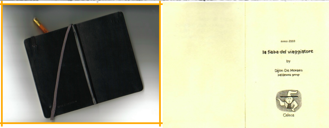
il taccuino del viaggiatore